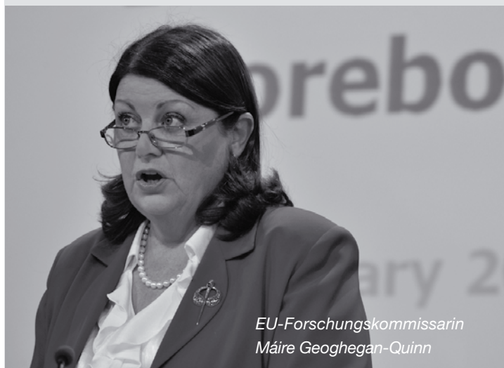
EU-Forschungskommissarin Máire Geoghegan-Quinn

Der EU ist es bisher nicht gelungen, den Rückstand bei den Innovationen gegenüber den USA und Japan wettzumachen. Das geht aus dem jetzt von der EU-Kommission veröffentlichten Leistungsanzeiger der Innovationsunion (IUS) 2010 hervor. Obwohl die Entwicklungen in den meisten EU-Mitgliedstaaten trotz der Wirtschaftskrise viel versprechend sind, seien die Fortschritte zu langsam. Die EU hat aber nach wie vor einen klaren Vorsprung gegenüber den aufstrebenden Volkswirtschaften Indiens und Russlands, Brasilien macht jedoch stetige Fortschritte und China holt schnell auf. Zu der Spitzengruppe bei den Innovationen in der EU zählen Schweden, Dänemark, Finnland und Deutschland. „Innovation ist für eine erfolgreiche moderne Wirtschaft so wichtig wie Wasser für das Leben. Sie ist die beste Möglichkeit der Volkswirtschaften, Arbeitsplätze zu schaffen“, sagte Forschungskommissarin Máire Geoghegan-Quinn. Der größte Abstand im internationalen Vergleich ist bei den Ausgaben der Unternehmen für Forschung und Entwicklung zu verzeichnen. Die Innovationslücke Europas – so der Bericht – ist in erster Linie auf den privaten Sektor zurückzuführen. Außerdem kommen aus der EU weniger wichtige Patentanmeldungen als aus den USA und Japan. Bei den öffentlichen Ausgaben für Forschung und Entwicklung und dem Export wissensintensiver Dienstleistungen liegt die EU jedoch vor den USA.