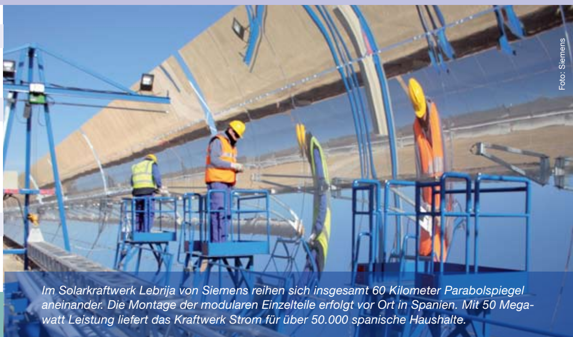
Im Solarkraftwerk Lebrija von Siemens reihen sich insgesamt 60 Kilometer Parabolspiegel aneinander. Die Montage der modularen Einzelteile erfolgt vor Ort in Spanien. Mit 50 Megawatt Leistung liefert das Kraftwerk Strom für über 50.000 spanische Haushalte.

Cecilia Malmström, EU-Kommissarin für Inneres, hat am Mittwoch die Notwendigkeit für einen einheitlichen Umgang mit Fluggastdaten in der EU betont. Mit ihrem jetzt vorgelegten Richtlinienvorschlag will sie zum einen Fahndungsmethoden verbessern, gleichzeitig aber auch einen angemessenen Schutz von Privatsphäre und personenbezogenen Daten gewährleisten. So genannte PNR-Daten dürfen nur zur Bekämpfung von schwerer Kriminalität und terroristischen Straftaten verwendet werden. Die Strafverfolgungsbehörden der Mitgliedstaaten müssen die Daten einen Monat nach dem jeweiligen Flug anonymisieren und dürfen sie insgesamt höchstens fünf Jahre lang speichern. Sensible Daten, die Aufschluss geben könnten über die ethnische Herkunft, die politische Einstellung oder die religiösen Überzeugungen der Passagiere dürfen in keinem Fall von den Fluggesellschaften an die Mitgliedstaaten übermittelt oder in irgendeiner Weise von den Sicherheitsbehörden verwendet werden. Die Mitgliedstaaten sollen auch keinen direkten Zugriff auf die Datenbanken der Fluggesellschaften haben. (ur)