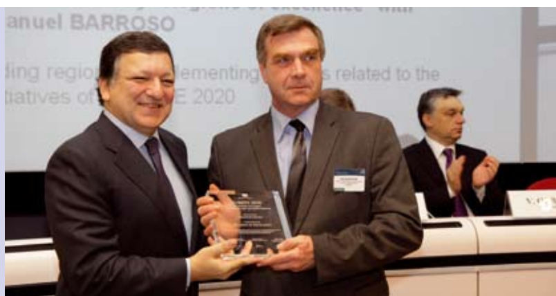
Der aktuelle Report zur Regionalpolitik der EU. (links).