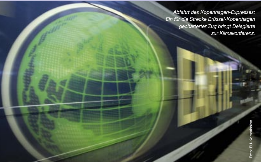
Abfahrt des Kopenhagen-Expresses: Ein für die Strecke Brüssel-Kopenhagen gecharterter Zug bringt Delegierte zur Klimakonferenz.

Der Gipfel wird sich mit der Wirtschafts- und Finanzkrise beschäftigen. Zwar stehen die Zeichen mittlerweile auf Konjunkturerholung, doch die Sanierung der strapazierten Staatshaushalte braucht Zeit. Die Staats- und Regierungschefs werden zudem über die neue EU-Wachstumsstrategie 2020 beraten. Auch die laufende UN-Klimakonferenz wird Gegenstand der Beratungen sein. Die EU hat sich ehrgeizige Ziele gesetzt und das Tempo vorgegeben. Der Gipfel soll die Strategie für die entscheidende Schlussrunde in Kopenhagen festlegen. (vth)