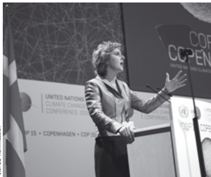
Die dänische Umweltministerin Connie Hedegaard, designierte EU-Kommissarin für den Klimaschutz, ist Gastgeberin der UN-Klimakonferenz.

→ http://ec.europa.eu/climateaction/eu_action/index_de.htm#global