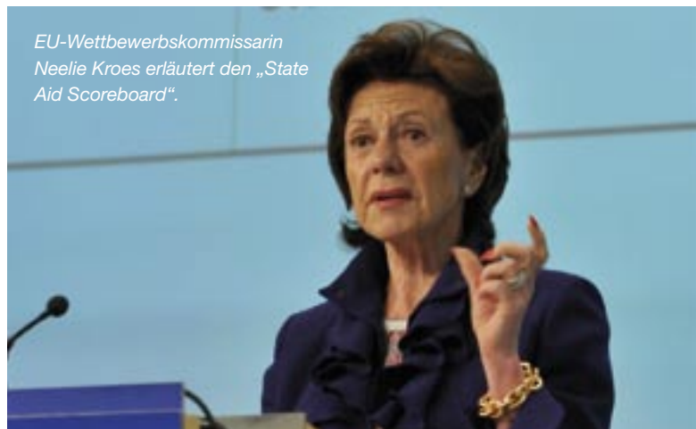
EU-Wettbewerbskommissarin Neelie Kroes erläutert den „State Aid Scoreboard“.

EU-Kommission hat bei Staatshilfen rasch reagiert