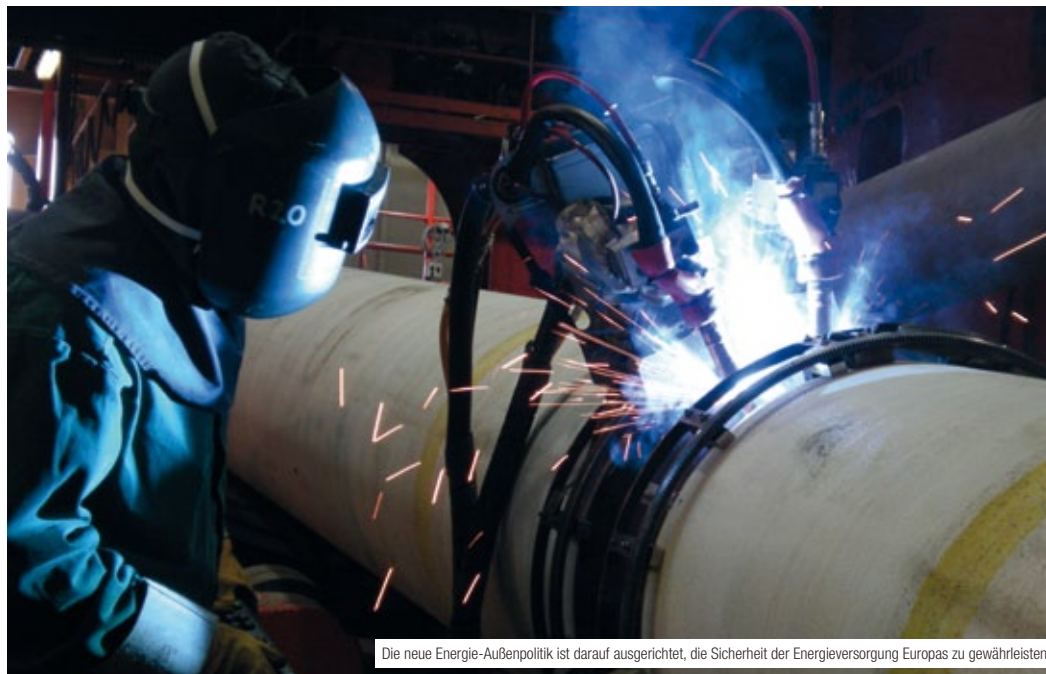
Die neue Energie-Außenpolitik ist darauf ausgerichtet, die Sicherheit der Energieversorgung Europas zu gewährleisten

www.bverfg.de/entscheidungen/rs20110907_2bvr098710.html