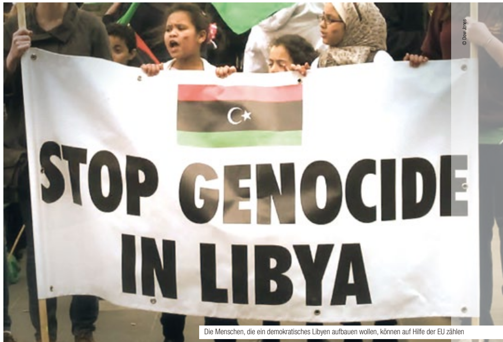
Die Menschen, die ein demokratisches Libyen aufbauen wollen, können auf Hilfe der EU zählen

Kommissionspräsident Barroso betonte in diesem Zusammenhang, wie sehr die Helfer auf eine funktionierende Verkehrsinfrastruktur angewiesen seien. „Es ist essenziell, dass unsere Helfer zu der Bevöl-