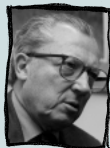
Jacques Delors, formand for Europa-Kommissionen 1985-1995

Fra midten af halvfjerdserne til midten af firserne er EF-samarbejdet præget af intern uenighed og stridigheder om især penge. Hvilke lande skal betale hvor meget for deltagelse i EF-samarbejdet? Hvem skal have del i udbetalingerne fra EF-kassen? Det er et par af hovedtemaerne i en periode, hvor Europas mest højtråbende politiker er den britiske jernlady – Margaret Thatcher.