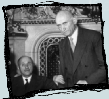
Jean Monnet (1888-1979), tv., og Robert Schuman (1886-1963)

Jean Monnet mente, at der burde etableres et europæisk samarbejde om produktion og salg af både kul og stål. Han fik den franske udenrigsminister, Robert Schuman, med på ideen, og den 9. maj 1950 lancerede Schuman tanken om, at Tyskland og Frankrig skulle samordne deres produktion af kul og stål. Andre lande blev også indbudt til at deltage, og i 1952 havde man skabt Det Europæiske Kul- og Stålfællesskab (EKSF) med deltagelse af yderligere fire lande – Italien, Belgien, Nederlandene og Luxembourg.