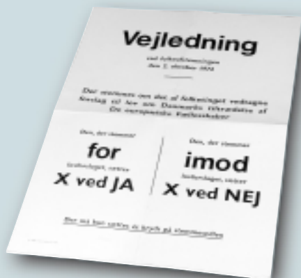
Vejledning til vælgerne ved folkeafstemningen i 1972

To tredjedele af vælgerne stemmer ja, og fra den 1. januar 1973 er Danmark medlem af EF.