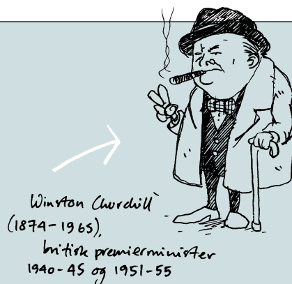
Winston Churchill (1874-1965), britisk premierminister 1940-45 og 1951-55

Europa-Kommissionen på internettet: www.europa-kommissionen.dk