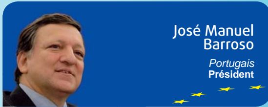
José Manuel Barroso Portugais Président