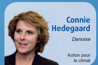
Connie Hedegaard Danoise Vice-présidente Action pour le climat