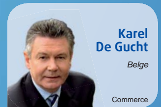
Karel De Gucht Belge Vice-président Commerce