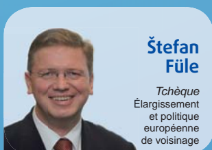
Štefan Füle Tchèque Vice-président Élargissement et politique européenne de voisinage