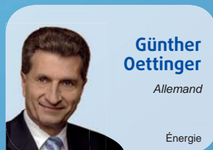
Günther Oettinger Allemand Vice-président Énergie