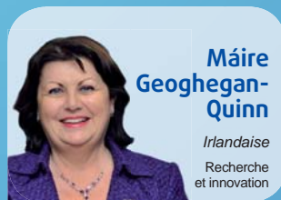
Máire Geoghegan-Quinn Irlandaise Vice-présidente Recherche et innovation