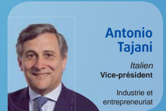
Antonio Tajani Italien Vice-président Industrie et entrepreneuriat