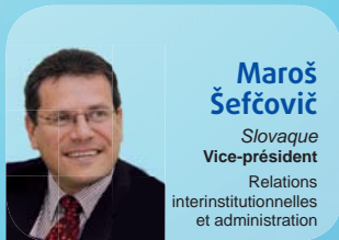
Maroš Šefčovič Slovaque Vice-président Relations interinstitutionnelles et administration