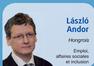
László Andor Hongrois Vice-président Emploi, affaires sociales et inclusion