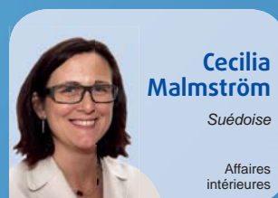
Cecilia Malmström Suédoise Vice-présidente Affaires intérieures