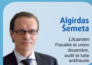
Algirdas Šemeta Lituanien Vice-président Fiscalité et union douanière, audit et lutte antifraude