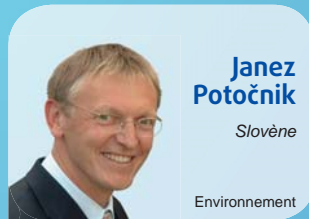
Janez Potočnik Slovène Vice-président Environnement