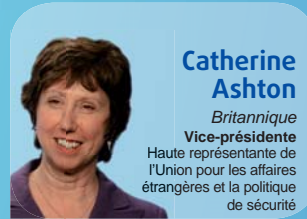
Catherine Ashton Britannique Vice-présidente Haute représentante de l'Union pour les affaires étrangères et la politique de sécurité