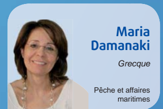
Maria Damanaki Grecque Vice-présidente Pêche et affaires maritimes