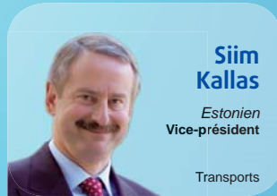
Siim Kallas Estonien Vice-président Transports