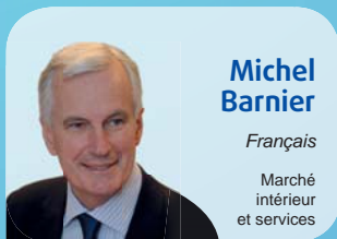
Michel Barnier Français Vice-président Marché intérieur et services