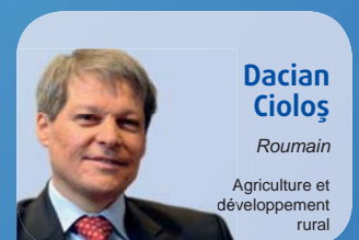
Dacian Cioloș Roumain Vice-président Agriculture et développement rural