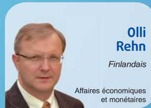
Olli Rehn Finlandais Vice-président Affaires économiques et monétaires