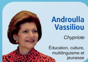
Androulla Vassiliou Chypriote Vice-présidente Éducation, culture, multilinguisme et jeunesse