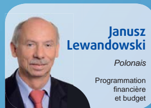
Janusz Lewandowski Polonais Vice-président Programmation financière et budget