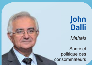
John Dalli Maltais Vice-président Santé et politique des consommateurs