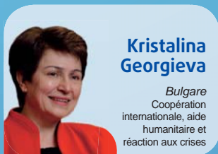
Kristalina Georgieva Bulgare Vice-présidente Coopération internationale, aide humanitaire et réaction aux crises