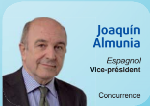
Joaquín Almunia Espagnol Vice-président Concurrence