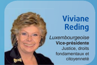
Viviane Reding Luxembourgeoise Vice-présidente Justice, droits fondamentaux et citoyenneté