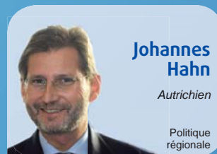
Johannes Hahn Autrichien Vice-président Politique régionale