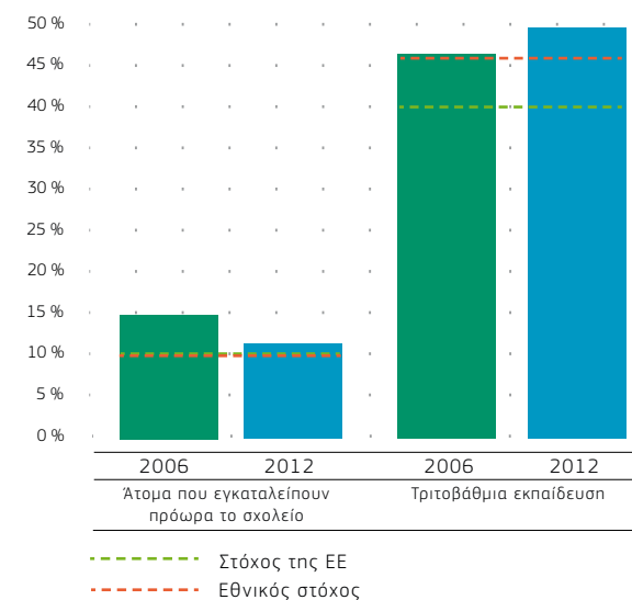
ΣΧΗΜΑ 1 ΣΤΡΑΤΗΓΙΚΗ «ΕΥΡΩΠΗ 2020» - ΣΤΟΧΟΙ

Το 2012 η Κύπρος απέδωσε καλύτερα από το μέσο όρο της ΕΕ που ήταν 12,6% στον τομέα της πρόωρης εγκατάλειψης του σχολείου. Είχε ένα από τα υψηλότερα ποσοστά επίτευξης στην τριτοβάθμια εκπαίδευση σε σύγκριση με τον ευρωπαϊκό μέσο όρο του 35,8% το 2012. Καθώς έχει σχεδόν επιτευχθεί ο εθνικός μέσος όρος, η πρόκληση στην ανώτερη εκπαίδευση είναι να εξοπλιστούν οι απόφοιτοι με τις δεξιότητες που απαιτούνται από τις επιχειρήσεις στο μεταβαλλόμενο οικονομικό περιβάλλον.