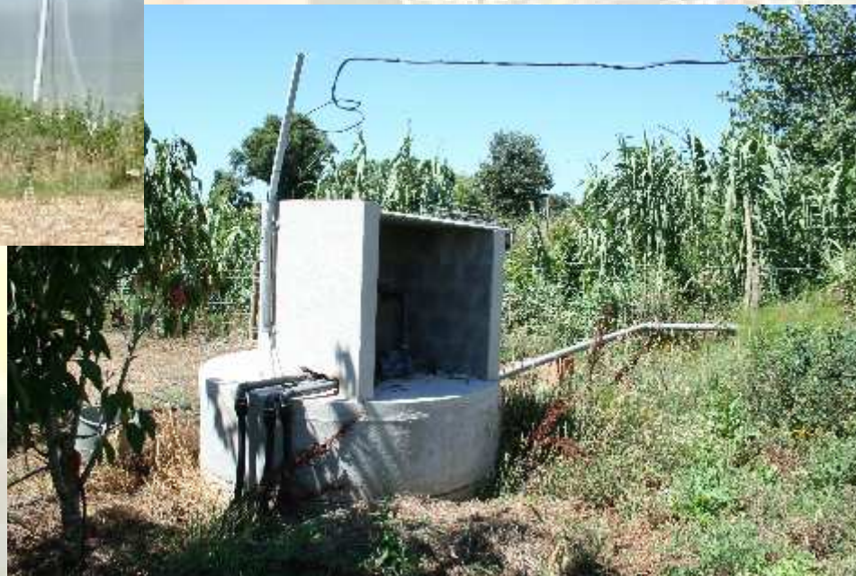
Tanque recuperação aguas da chuva

European Young Farmers' day - 17 de Abril de 2007