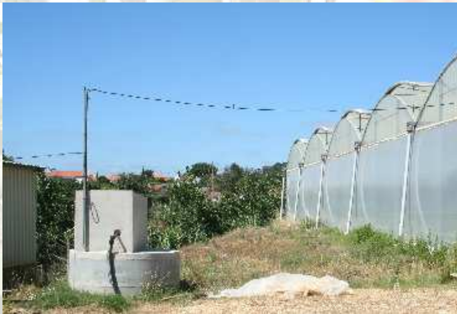
Tanque de aguas de drenagem