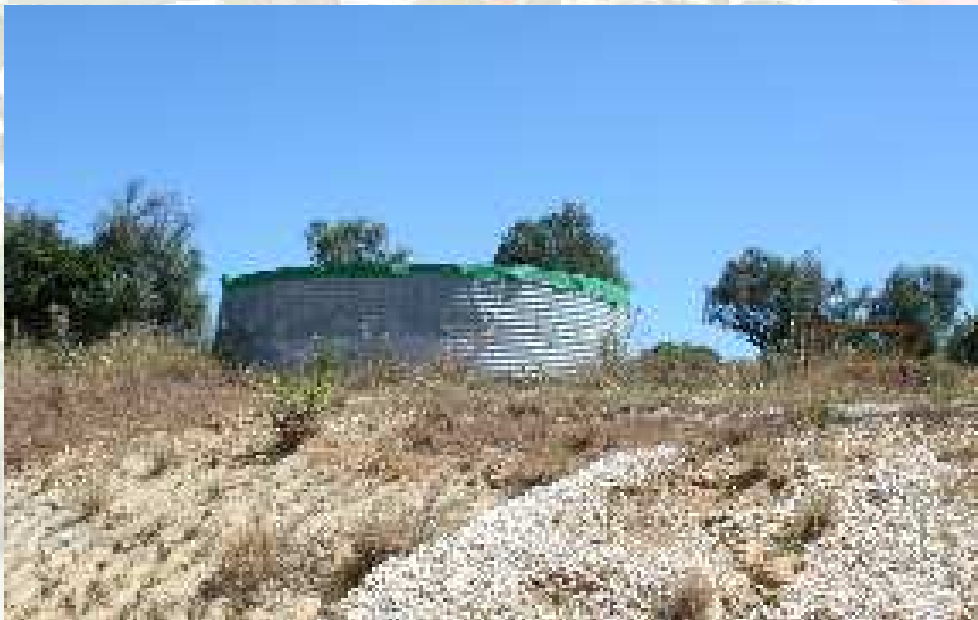
Tanque principal 104 m 3