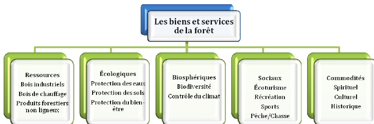
Figure 1: Les catégories principales des services de la forêt

Il existe une autre sorte de classification pertinente dans le cadre de cette étude, qui fait une distinction entre le commerce des biens et services forestiers. Les biens et services de la forêt sont échangés au niveau des marchés et leur valeur peut être observée directement à l'aide des prix du marché, par exemple, le bois, les bois de chauffage et les produits forestiers non ligneux. Lorsque les biens et services non marchands ne sont pas échangés dans les commerces, aucun prix ne peut être directement observé comme celle sur la protection de l'eau, la protection des sols, la protection du bien-être, la protection de la biodiversité, le contrôle du climat, le tourisme, les loisirs, les sports, les bienfaits spirituels, culturels et historiques. Ces derniers sont fournis à la société ou à certains groupes d'utilisateurs de forme gratuite ou à un prix symbolique bien inférieur au coût de production. Toutefois, l'absence de prix ne veut pas dire que ces biens et services n'ont aucune importance pour la société ou qu'ils ne contribuent pas au bien-être de l'homme.