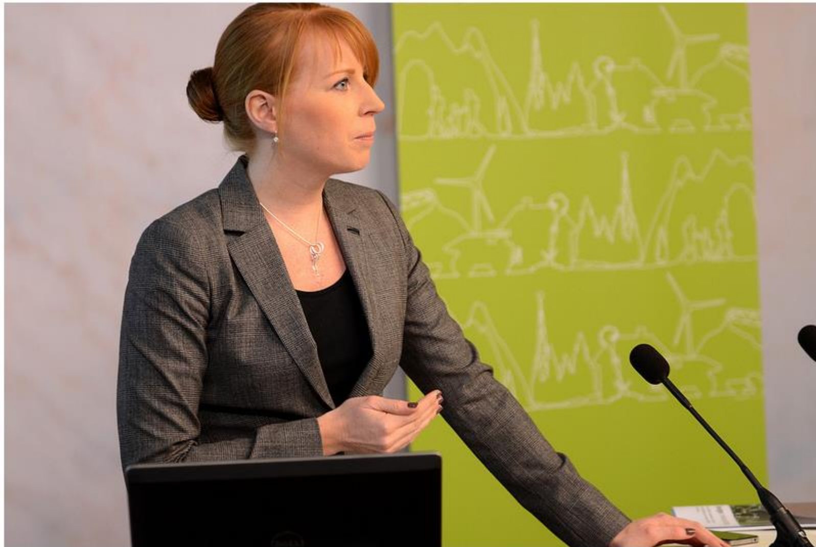
Näringsminister Annie Lööf presenterar Sveriges mineralstrategi.